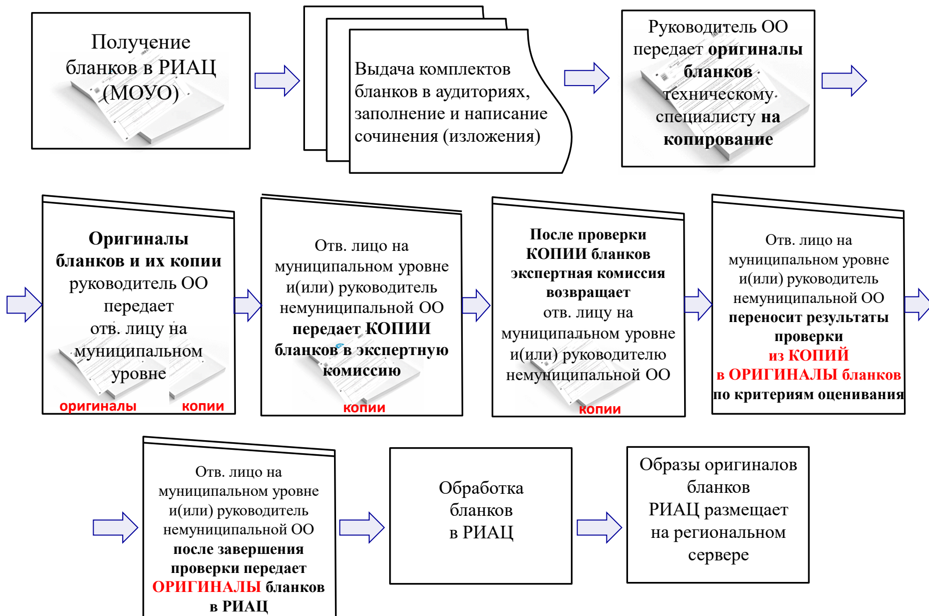
СХЕМА ДВИЖЕНИЯ БЛАНКОВ ИТОГОВОГО СОЧИНЕНИЯ (ИЗЛОЖЕНИЯ)